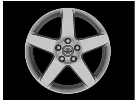
Serapis 7,5 x 17"