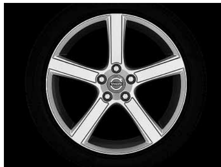
Midir 8,0 x 18"