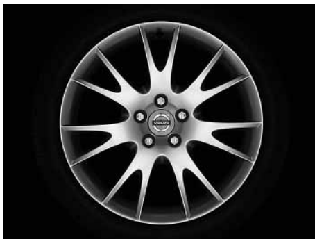
Mirzam 8,0 x 18"