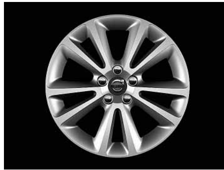
Sirona 7,5 x 17"