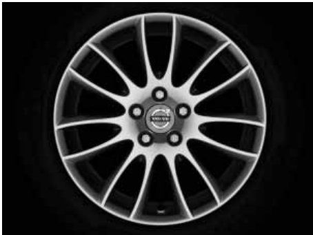
Sadira 7,5 x 17"