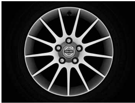
Castula 7,5 x 16"