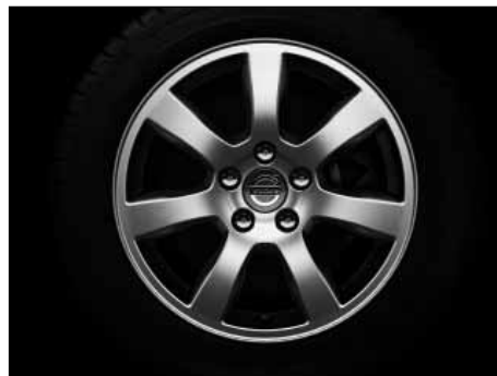
Oden 7,0 x 16"