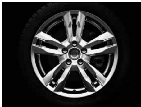
Njord 8,0 x 17"