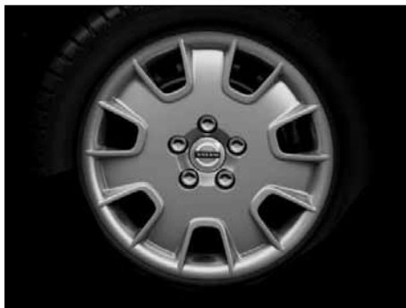
Stahlfelge 7,0 x 16"