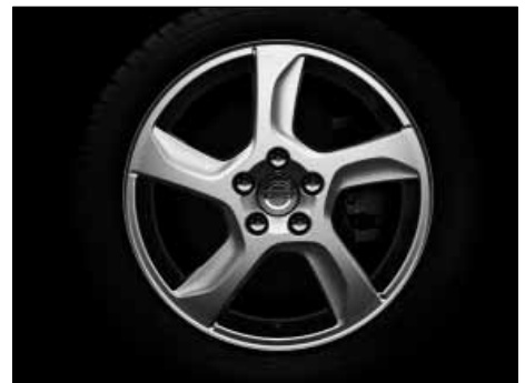
Balder 7,0 x 17"