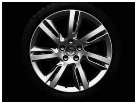
Sleipner 8,0 x 18"